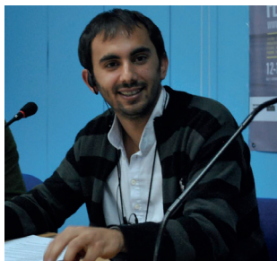
SAMI MUSTAFA KOSOVO/ FRANCUSKA

Małgorzata Mirga-Tas je poljsko-romska likovna umetnica, vajarica, slikarka, edukatorka i aktivistkinja. Ona je izabrana da predstavlja Poljsku na 59. bijenalu u Veneciji; prva je romska umetnica koja je predstavljala ovu zemlju. Osnivačica je fondacije JAW DIKH koja realizuje umetničke i edukativne projekte i ugošćuje romske umetnike i umetnice u programu rezidencije u Čarnoj gori u Poljskoj.