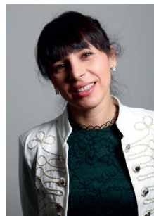
MAŁGORZATA MİRGA-TAS POLJSKA