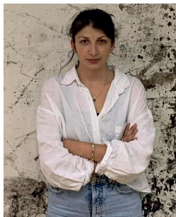
SELMA SELMAN BOSNA I HERCEGOVINA

Zita Moldovan je jedna od najpoznatijih romskih glumica u Rumuniji, novinarka i suosnivačica prvog romskog pozorišta u Rumuniji – pozorišne trupe Giuvlipen. Takođe je i modna dizajnerka koja stvara svoje kolekcije nadahnuta kulturnim nasleđem tradicionalne odeće u romskoj zajednici.